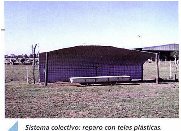
Sistema colectivo: reparo con telas plásticas.