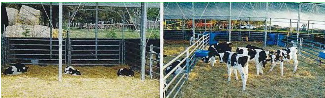
Foto 7. Sistema de crianza colectivo. Sitio Argentino de Producción animal. "Bienestar en la crianza de terneros" Med. Vet Gaston Conzolino*. 2011. Producir XXI, Bs. As., 20(241):40-45.

*Depto. Técnico - Comercial DUCREM S.A. gastonconzolino@ducrem.com.ar www.ducrem.com.ar www.produccion-animal.com.ar