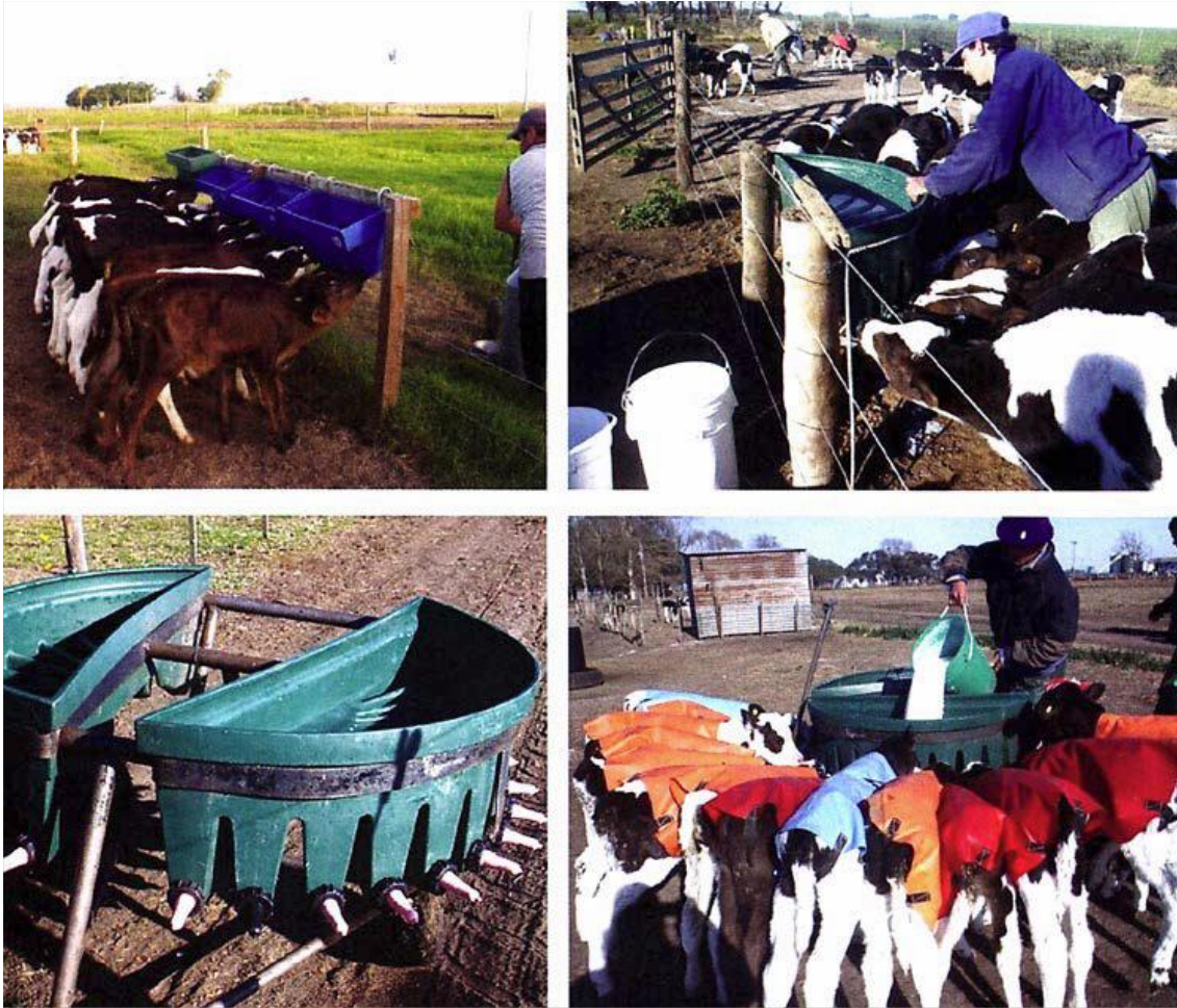
Foto 8. Sistemas colectivos con recipiente dividido para una mejor administración a cada ternero.

“Sistemas colectivos de crianza de terneras “