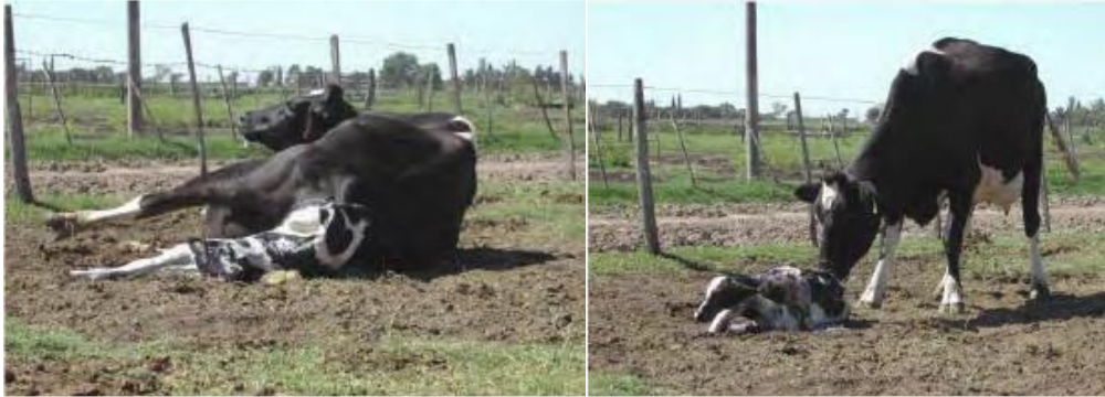
Foto 1 y 2 Nacimiento

Fuente: Proyecto Lechero. 2007. INTA Centro Regional Santa Fe. Hoja Informativa para Productores. www.produccion-animal.com.ar