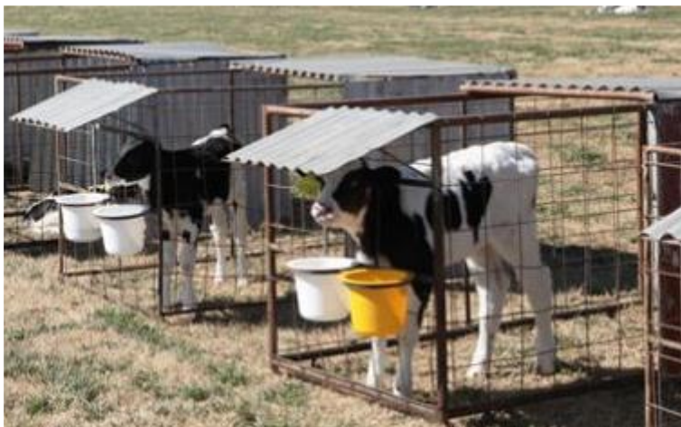
Foto 6. Sistema individual de jaulas. . Agromensajes 46:64-67 (Diciembre 2016) "Sistema de crianza artificial y Bienestar animal" Bernaldez, ML y otros. Cátedra de Nutrición Animal. Fac. de Cs. Agrarias. UNR.