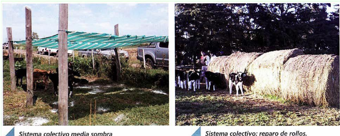
Sistema colectivo media sombra

Foto 10. "Sistemas colectivos de crianza de terneras " Ing. Agr. Guillermina Osacar, Dr. Guillermo Berra. 2013. Producir XXI, Bs. As., 21(259):36-40. osacarb@copenet.com.ar Sitio Argentino de Producción Animal. www.produccion-animal.com.ar