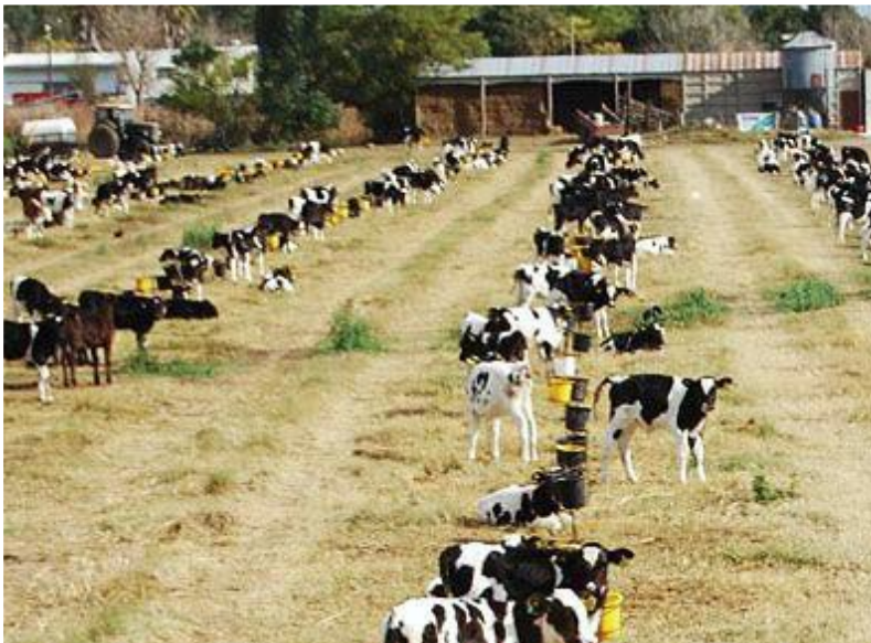
Foto 3.

• Metabolismo ruminal: cuando se consume alimento balanceado se empieza a producir cantidades significativas de calor debido al proceso de fermentación por las bacterias ruminales, produciendo una fuente energética.