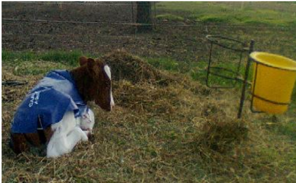
Foto 4. Terneras con capas protectoras. AGROMENSAJES 42 47-50 AGOSTO 2015. Artículo de divulgación Crianza artificial de las terneras en el Módulo de Producción Lechera de la Facultad de Ciencias Agrarias Dichio, L.; Amprimo, I.; Azzaro, C.; Almirón, L.; Puccio, G.; Galli, J. Cátedra Sistemas de Producción Animal.