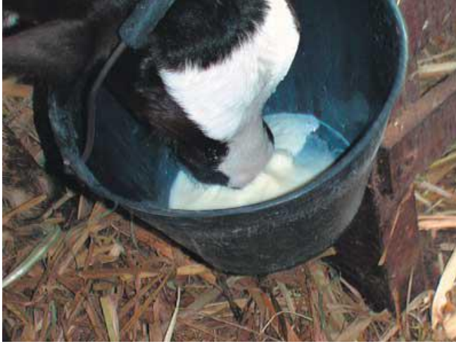
Foto 3. Ternera tomando del balde. AGROMENSAJES 42 47-50 AGOSTO 2015. Artículo de divulgación Crianza artificial de las terneras en el Módulo de Producción Lechera de la Facultad de Ciencias Agrarias Dichio, L.; Amprimo, I.; Azzaro, C.; Almirón, L.; Puccio, G.; Galli, J. Cátedra Sistemas de Producción Animal.