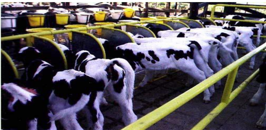
Foto 9. Sistema colectivo con manga con mamaderas o baldes con tetinas para administración de la dieta láctea.

Sitio Argentino de Producción Animal. www.produccion-animal.com.ar